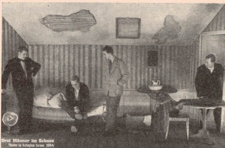
Der Millionär im Dachstübli

den Leib geschnitten und lagen ganz im Bereich des jugendlichen Ausdrucksvermögens, so daß sich nirgends ein störender Mißton unangenehm bemerkbar machte und die Wiedergabe des Stückes vorzüglich gelang. P. Notker konnte mit seinem Debüt voll und ganz zufrieden sein. Ein Gratulatur ist hier am Platze. — Gegen Ende des Schuljahres ergötzen sich die Lyzeisten noch an Goldonis Lustspiel «Der Diener zweier Herren», das, von A. Müller ins Schweizerische übersetzt, von der Freien Bühne Sarnen in Obwaldnermundart als «Zwee Meischter und ei Chnäch» schmissig wiedergegeben wurde und verdienten Erfolg einheimste.